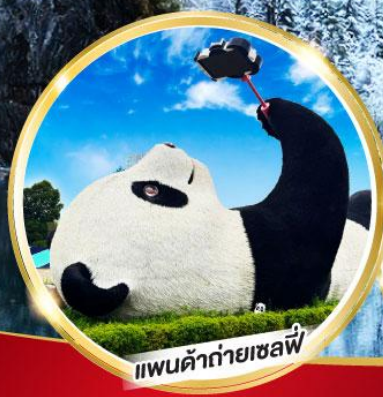
แพนด้ายักษ์