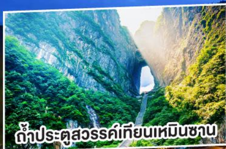
ถ้ำประตูสวรรค์เทียนเหมินชาน

สัมผัสมนต์ขลังผู่หลงเจิ้น พิษิตรีเบียงแก้วเทียนเหมิน