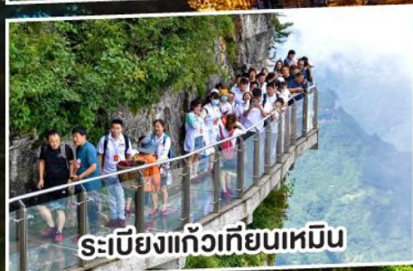
ระเบียงแก้วเทียนเหมิน