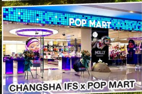
CHANGSHA IFS x POP MART