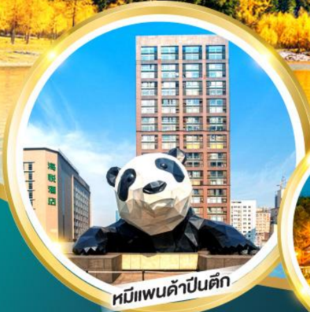
หมีแพนด้าป็นตึก