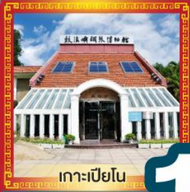
เกาะเปียว