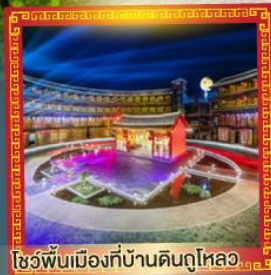
โชว์พื้นเมืองที่บ้านดินตุไหลง