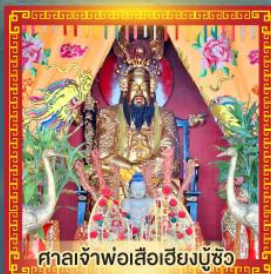
ศาลเจ้าพ่อเสือฮียงบู๊ซิว