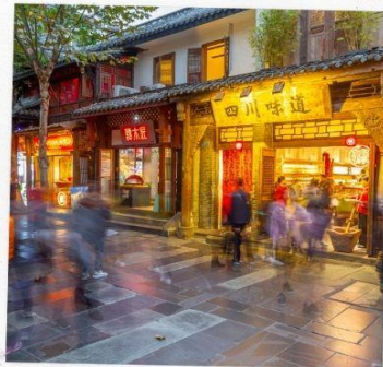
ถนนชอยกว้างแคบ