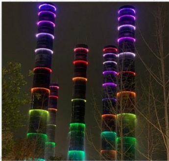
ชมแสงสีห้าง SKP