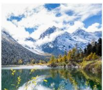
ปี้เฉิงโกว