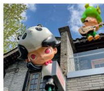
ถนนคนเดินชอยกว้างแคบ