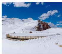
ต้ากู่ปิงชว่น