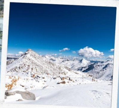
ภูเขาหิมะการ์เซีย ต่ากู่ปิงชว่น