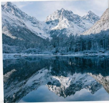
อุทยานปีเพิงโกว