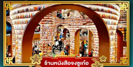
ร้านหนังสือจูกูเก๋