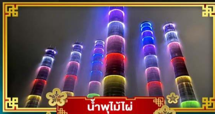
น้ำพุไม้ไฟ