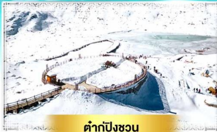
ต้ากู่ปิงชว่น