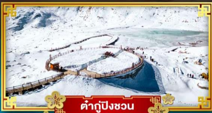
ต้ากู่ปิงชวอน

สัมผัสความหนาว เที่ยวจัดเต็ม “4 อุทยานสวรรค์”