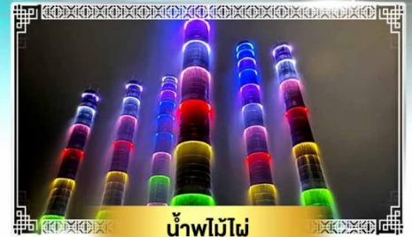
น้ำพุไม้ไฟ