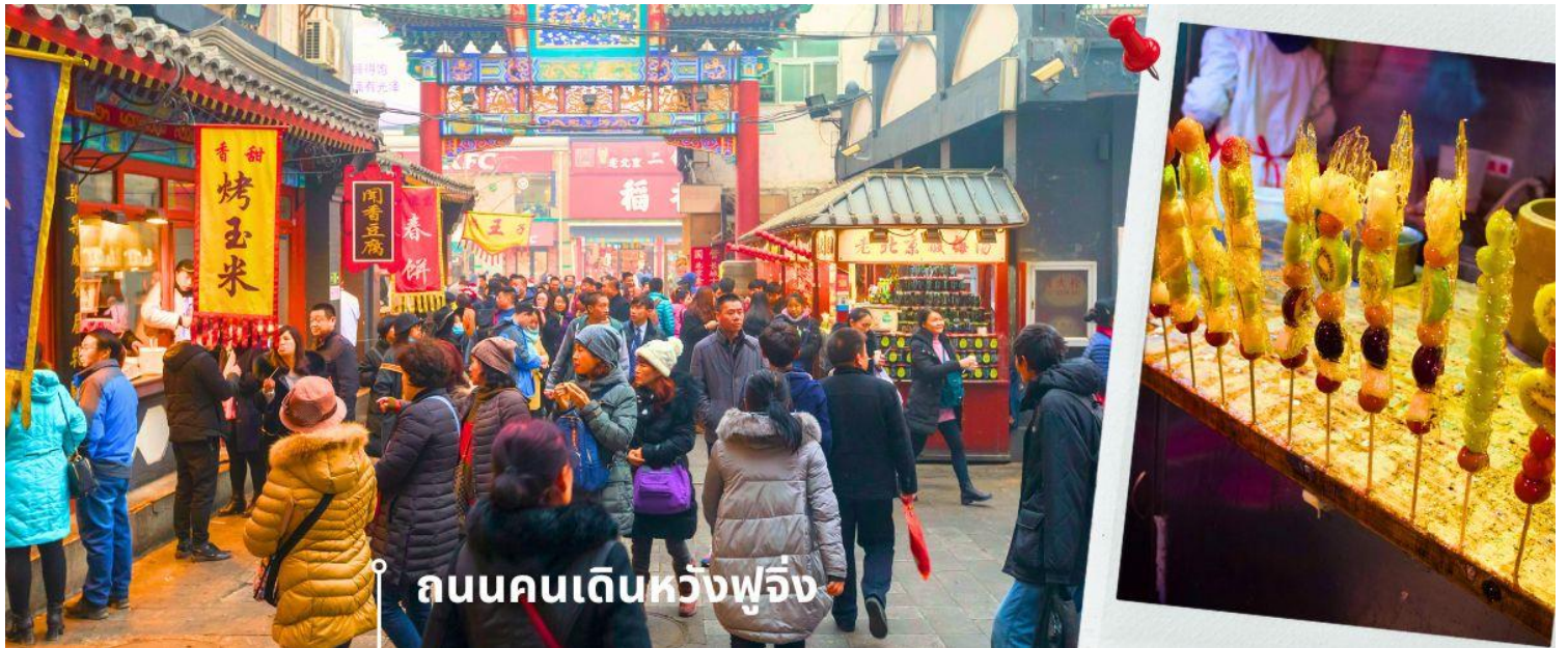
ถนนคนเดินหวังฟูเจิง

นำท่านเข้าสู่ที่พัก Holiday inn Express หรือ Royard Hotel / หรือเทียบเท่า