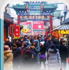
ถนนคนเดินหวังฟูจิ่ง