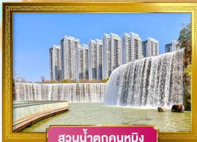
สวนน้ำตกคูนหมิง