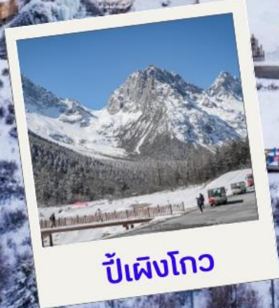
ปี้เฟิงโกว