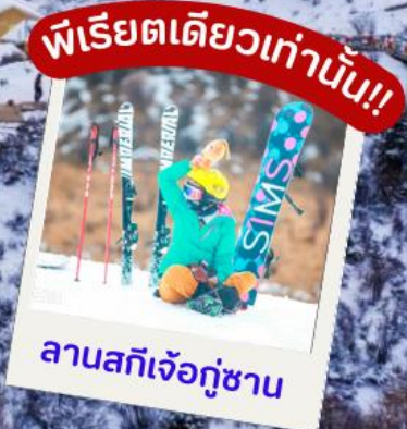
พีเรียตเดี่ยวเท่านั้น!!