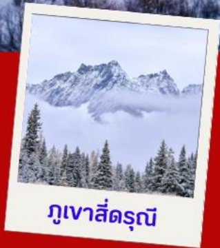
ภูเขาสีดรุณี