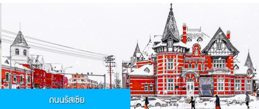
ถนนรัสเซีย

เที่ยง รับประทานอาหารกลางวัน ณ ภัตตาคาร หลังอาหารท่านเดินทางสู่สถานีรถไฟความเร็วสูงเมืองนางโปซาน เพื่อเตรียมขึ้นรถไฟไปเมืองต้าเหลียน 13.14 น. นำท่านขึ้นรถไฟความเร็วสูงขบวนที่ G8037 (13.19/19.28) เพื่อเดินทางไปยังเมืองต้าเหลียน **รวมเจ้าหน้าที่ขนส่งสัมภาระขึ้นรถไฟความเร็วสูงท่านละ 1 ใบ** 19.28 น. นำท่านเดินทางถึงสถานีรถไฟเมืองต้าเหลียน นำท่านเดินทางโดยรถบัสปรับอากาศสู่ตัวเมืองต้าเหลียน