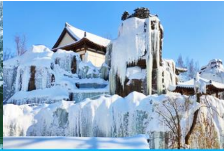
หมู่บ้านวัฒนธรรมเกาหลี