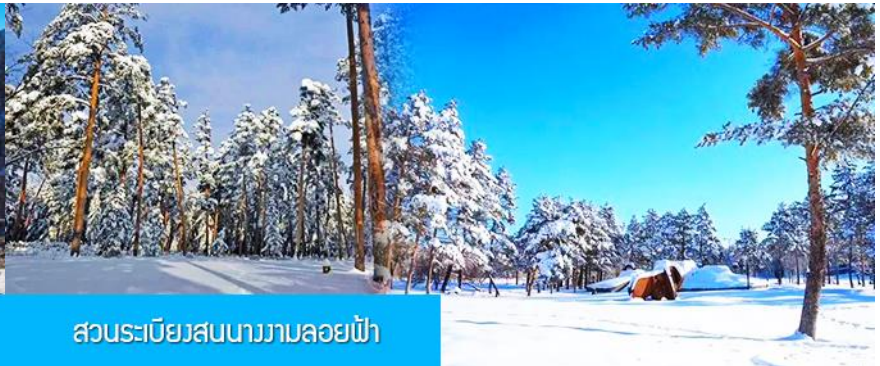
สวนระเบียงสนงามลอยฟ้า