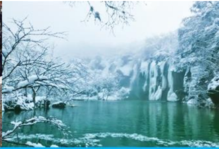
สระน้ำมรกต ฉางไป่ซาน