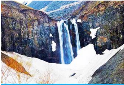
น้ำตกฉางไป่ซาน