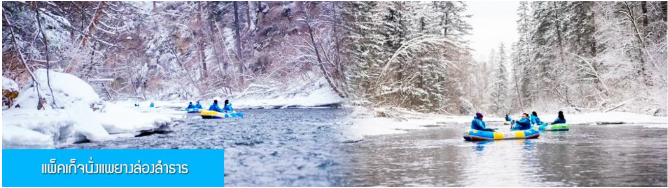
แพ็คเก็จนั่งแพยางล่องลำธาร

วันที่ห้า เมืองนางโปซาน – OPTION เสริม ล่องแพยางชมดินแดนเทพนิยาย – นั่งรถไฟความเร็วสูงกลับเมืองต้าเหลียน