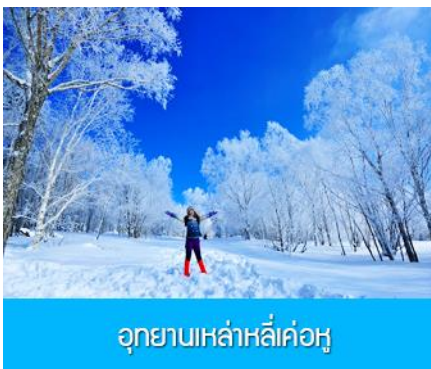
อุทยานเหล่าหลี่เค่อหู

พักที่ QIUSHA MEISHU HOTEL โรงแรมระดับ 4 ดาวท้องถิ่นหรือเทียบเท่า ในเมืองฉางไป่ซาน