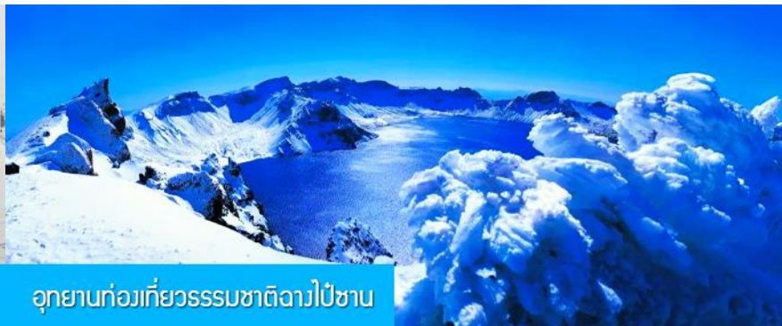
อุทยานท่องเที่ยวธรรมชาติลาวีไซซาน