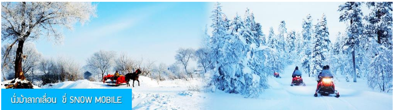
นั่งม้าลากเลื่อน ยี่ SNOW MOBILE

หมายเหตุ การเดินเที่ยวชมอุทยานทำได้ด้วยการเดินเท้า เข้าและออกจากอุทยานซึ่งจะใช้เวลาขาไป 40 นาที จากกลับ 40 นาที ระหว่างทางต้องลุยหิมะแต่สามารถชมและถ่ายภาพวิวหิมะได้ตลอดทาง และท่านสามารถ เลือกซื้อ OPTION เสริมที่ 1 ด้วยการนั่งม้าลากเลื่อน 1 ขา 马拉雪橇 (ใช้เวลา 15 นาทีอัตราค่าบริการท่านละ 240 หยวนหรือ 1,200 บาทต่อเที่ยว) หรือเลือกซื้อ OPTION เสริมที่ 2 ด้วยการขี่ SNOW MOBILE 1 ขา 雪地摩托车 (ใช้เวลา 10 นาทีอัตราค่าบริการท่านละ 300 หยวนหรือ 1,500 บาทต่อเที่ยว) หมายเหตุ โปรแกรมเสริมเป็นโปรแกรมที่ท่านต้องเสียค่าใช้จ่ายเองด้วยความสมัครใจ สำหรับท่านที่ไม่ต้องการเลือกซื้อกิจกรรมดังกล่าวสามารถเลือกวิธีเดินเท้าเข้าชมและออกจากอุทยานได้