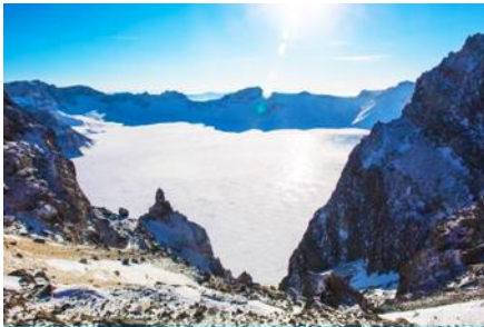
ทะเลสาบเทียนฉือ

อุทยานท่องเที่ยวธรรมชาติฉางไป๋ซาน 长白山景区 แหล่งท่องเที่ยวธรรมชาติและเป็นภูเขาศักดิ์สิทธิ์สำหรับชาวจีนและชาวเกาหลี ภูเขาที่ตั้งอยู่บนเทือกเขาฉางไป๋ซานที่ทอดยาวจากด้านทิศตะวันตกเฉียงใต้ ไปยังด้านทิศตะวันออกเฉียงเหนือด้วยความยาวกว่า 1,000 กิโลเมตร แนวเทือกเขาพาดผ่านพื้นที่ทางภาควันออกเฉียงเหนือของจีนและพื้นที่ทางตอนเหนือของประเทศเกาหลีเหนือ ประกอบด้วยยอดเขาทั้งหมด 16 ยอด ยอดเขาฉางไป๋ซานเป็นยอดเขาที่สูงที่สุดด้วยความสูง 2749 เมตร เมื่ออยู่บนยอดเขาสามารถมองเห็น ทะเลสาบเทียนฉือ 天池 ทะเลสาบที่เกิดจากการระเบิดของภูเขาไฟ และเป็นทะเลสาบบนยอดเขาที่มีความสูงเหนือระดับน้ำทะเล 2194 เมตร อีกทั้งเป็นทะเลสาบที่ลึกที่สุดในประเทศจีน โดยมีจุดที่ลึกที่สุดคือ 373 เมตร