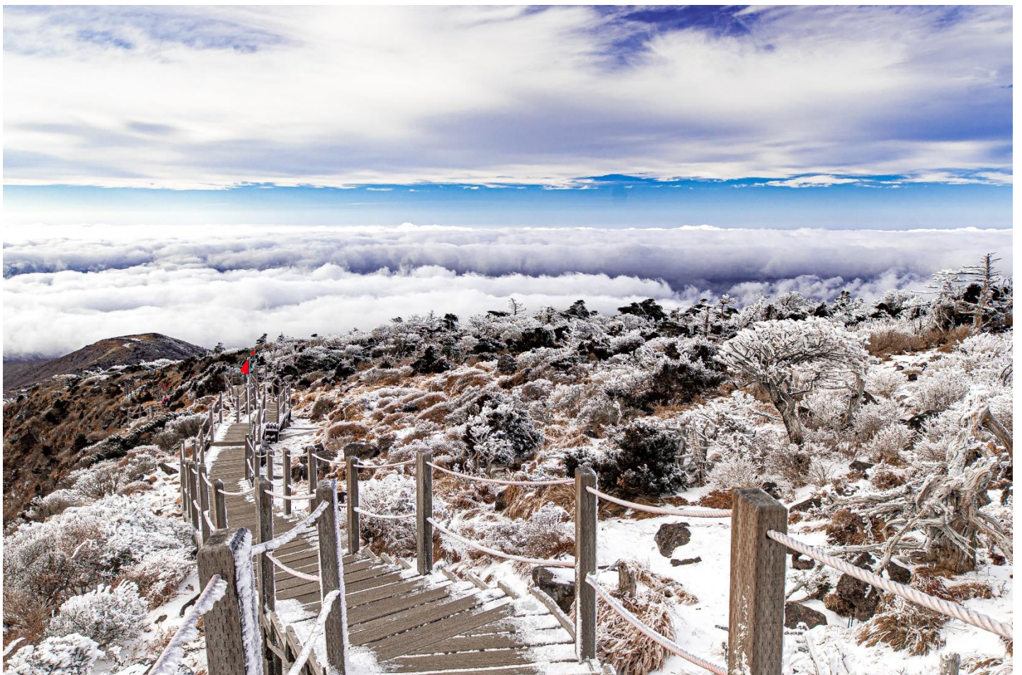
T2G-KMG14KY POPULAR KUNMING คุณหมิง ภูเขาหิมะเจียวจื่อ เขาซีซาน 4D 3N (KY)

เช้า รับประทานอาหารเช้า ณ ห้องอาหารของโรงแรม