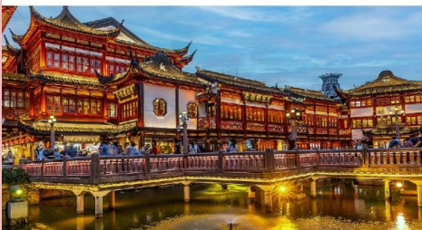
ตลาดร้อยปีเงินหวางเมี่ยว