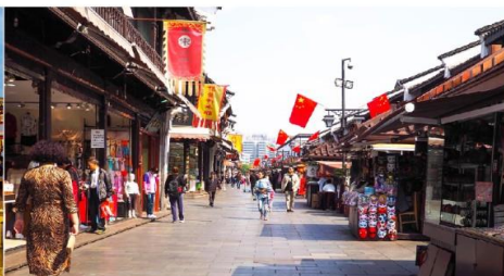
ถนนโบราณเหอฟางเจีย