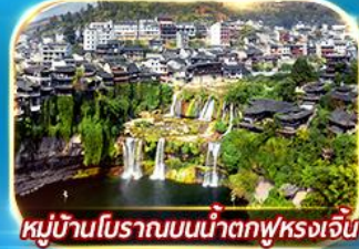
หมู่บ้านโบราณบนน้ำตกฟุรงเจิน