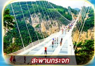
สะพานกระจะก