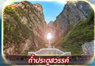
ทำประตูลงสวรรค์