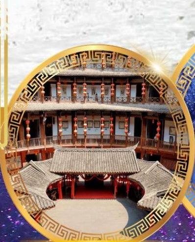
เมืองโบราณลั่วไต้

อุทยานภูเขาสี่ดรุณีหุบเขาขงเฉียวโกว อุทยานป่าเผิงโกว ชมความงามระดับ 4A อุทยานสวรรค์ภูเขาหิมะการ์เซียต้ากู่ปิงชว่น เมืองโบราณลั่วไต้ ถนนโบราณจินหลี่ ชมแสงสียามค่ำคืนที่ห้างสรรพสินค้า SKP สักการะวัดต้าเจี๊ว ถนนไท่กู่หลี่ ช้อปปิ้งถนนชุนชี่ซู่ แพนด้าปิ่นตึก-IFS