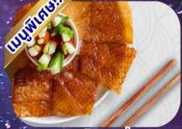
แบบเปิดปักกั้ง