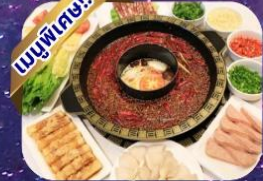
แบบสุกั้หมาล่า