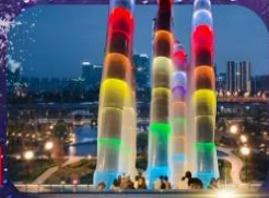
เข็ลอินห้ำง SKP