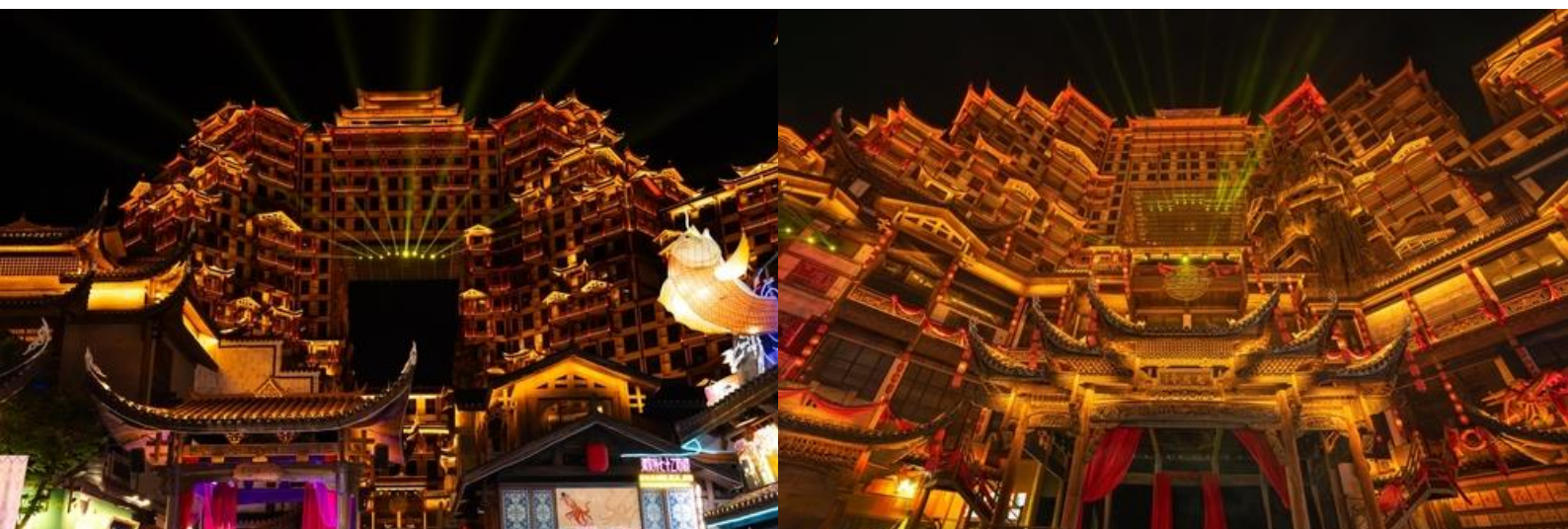
นำทุกท่านเข้าสู่ที่พัก MELLOW HOTEL ระดับ 4 ดาวท้องถิ่นหรือเทียบเท่า

20.20 เดินทางถึง ท่าอากาศยานต้าหยง เมืองจางเจี๋ยเจี๋ย ประเทศจีน (เวลาท้องถิ่นเร็วกว่าประเทศไทย 1 ชั่วโมง) นำท่านผ่านขั้นตอนการตรวจหนังสือเดินทาง และตรวจรับสัมภาระเรียบร้อย นำท่านเดินทางโดยรถบัสนำท่านสู่ เมืองจางเจี๋ยเจี๋ย หรือ เมืองต้าหยง เป็นหนึ่งในเมืองท่องเที่ยวที่สำคัญที่สุดของจีนซึ่งลือชื่อด้วยทรัพยากรการท่องเที่ยวที่มีเอกลักษณ์ของตนเองแหล่งท่องเที่ยวสำคัญใน เมืองจางเจี๋ยเจี๋ยเป็นพื้นที่ป่าไม้ถึง 98% ซึ่งนับเป็นออกซิเจนทางธรรมชาติและเนื่องจากเป็นเมืองที่อยู่ห่างไกลที่น้อยคนจะเดินทางไป ถึงอีกทั้งชาวจางเจี๋ยเจี๋ยผู้ซึ่งรักในธรรมชาติได้ดำเนินนโยบายอนุรักษ์ธรรมชาติอย่างมีประสิทธิภาพ เมืองจางเจี๋ยเจี๋ยจึงประดิษฐานดินแดนบริสุทธิ์ของโลกที่แห่งนี้ยังเป็นแหล่งชุมชนของ 33 ชนเผ่า เช่น ชนเผ่าถู่เจี๋ย ชนเผ่าไป่ และชนเผ่าเหมียว สภาพภูมิศาสตร์ที่มีเอกลักษณ์ทำให้วัฒนธรรมของชนเผ่าต่างๆได้รับการอนุรักษ์เป็นอย่างดี จากนั้นนำท่านชม ตึกมหัศจรรย์ 72 แห่งเมืองจางเจี๋ยเจี๋ย แลนด์มาร์คใหม่ล่าสุดที่เป็นเสมือนแม่เหล็กดึงดูดนักท่องเที่ยวและผู้มาเยือน ถูกสร้างขึ้นโดยนำเอาจุดเด่นของเมืองจางเจี๋ยเจี๋ยมารวมกัน โดยมีอาคารสูงที่สร้างจำลองถ้ำประตูสวรรค์ บ้านยกพื้นโบราณที่เป็นบ้านพื้นเมืองของชาวถู่เจี๋ย นอกจากนี้ที่นี่ยังถูกออกแบบให้กลายเป็นแหล่งรวมของ รีสอร์ท โฮมสเตย์ ร้านอาหาร ผังสตรีทฟู้ด ผับบาร์ ร้านขายของที่ระลึก ที่ตกแต่งด้วยแสงสีสุดอลังการ (รวมบัตรเข้าชม)