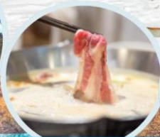
เมนูพิเศษ สุกี้หม่าล่า