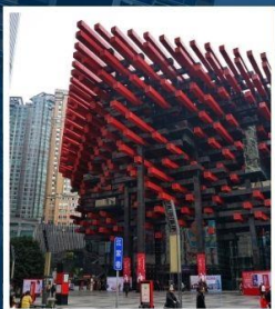
พิพิธภัณฑ์ศิลปะ ฉงชิ่ง