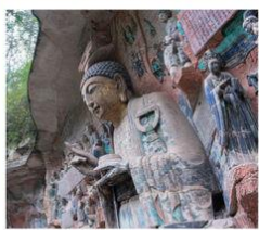
พระพุทธรูปหินแกะสลักต้าจู้