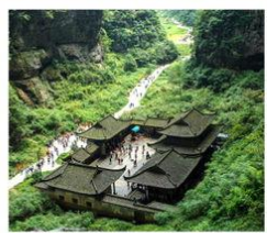
หลุมฟ้า สะพานสวรรค์

พระพุทธรูปแกะสลักหิน / หมู่บ้านโบราณฉือซีชิว / มหาศาลาประชาคม / อุทยานหลุมฟ้าสะพานสวรรค์ / ระเบียบกระจก / อุทยานเขานางฟ้า / ถนนต้นจื่อซือ พิพิธภัณฑ์ศิลปะธงช้าง / ตึกหุยซิง (ตึก 22 ชั้น) / ถนนคนเดินเจียงฟางเป่ย์ / หงหยาดัง / ศูนย์หมีแพนด้า / ที่ทำการไปรษณีย์หมีแพนด้า / ถนนโบราณจินหลี่