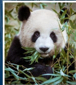
ศูนย์อนุรักษ์หมี แพนด้า