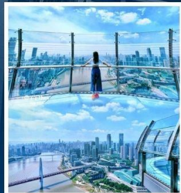
RAFFLES CITY CHONGQING