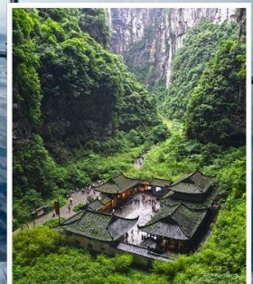
อุทยานหลุมฟ้า สะพานสวรรค์