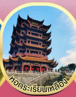
หอคระเรียนเหลื่อ