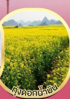
ทุ่งดอกน้ำมัน

เจาบูต้ง นมัศการองค์เหล่าติวเอียะ เทพแห่งความมั่งคั่ง