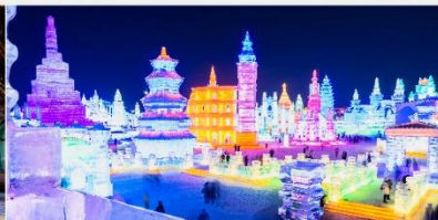
เทศกาลโคมไฟน้ำแข็ง