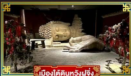
เมืองใต้ดินหวู่เจิ้ง

“กำแพงหิมะ”...สิ่งมหัศจรรย์ของโลก พระราชวังต้องห้าม อดีตพระ-ราชวังหลวงสุดยิ่งใหญ่