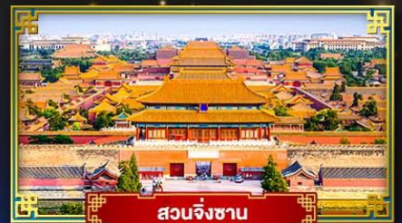
สวนจิงซาน