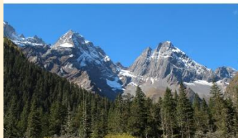
ภูเขาสี่ดรุณี