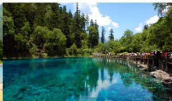
อุทยานแห่งชาติจิวจ้ายโกว