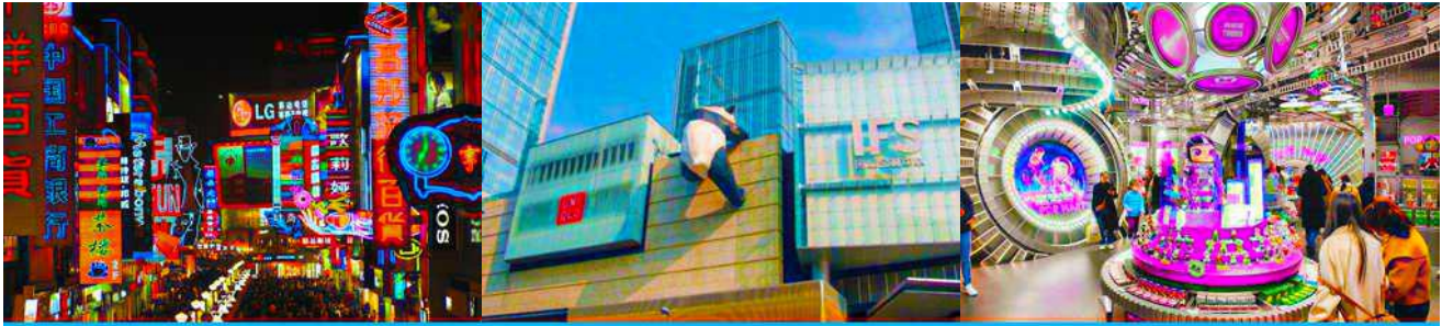
ถนนคนเดินชุนชี่ลู่

พักที่ JIUYUAN HOTEL ระดับ 4 ดาวห้องถิ่นหรือเทียบเท่าในอุทยานจิวจ้ายโกว