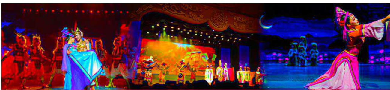
Romantic Show of Jiuzhai

หลังอาหารนำท่านสามารถเลือกซื้อรายการทัวร์เสริม พิเศษการแสดง ชุด Romantic Show of Jiuzhai