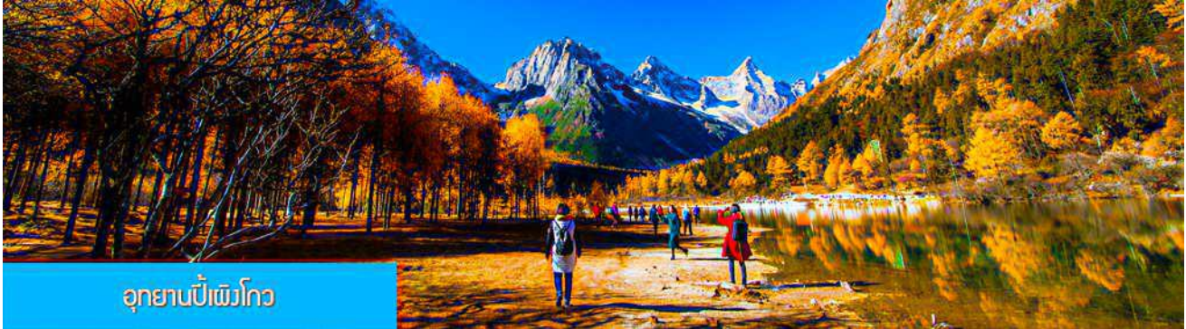
อุทยานปีเฝิงโกว

พักที่ JIXIANGGU INTER HOTEL 4* หรือ โรงแรมระดับเดียวกันพื้นเมือง