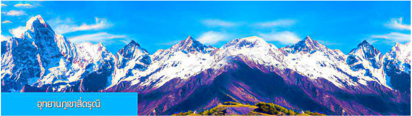
อุทยานภูเขาสี่ดรุณี

พักที่ HOLIDAY INN EXPRESS โรงแรมระดับ 4 ดาวท้องถิ่นหรือเทียบเท่าในเมืองตูเจียงเยียน