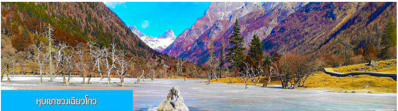
หุบเขาชวงเจียวโกว

นำท่านเที่ยวชม หุบเขาชวงเจียวโกว 双桥沟景区 ที่เป็นแหล่งท่องเที่ยวที่สวยงามที่สุดแห่งหนึ่งในเขตอุทยานสี่ดรุณี นำท่านนั่งรถบัสของอุทยานที่วิ่งไปผ่านเส้นทางที่สร้างคู่ขนานกับลำธารภายในหุบเขา ท่านจะได้สัมผัสกับความสวยงามของทัศนียภาพธรรมชาติที่หาชมได้ยาก โดยมีภูเขาหิมะสูงตระหง่านอยู่เบื้องหลัง ธารน้ำใสไหลริน และสระน้ำที่มีสีเขียวมรกต ในฤดูใบไม้ผลิและฤดูร้อนท่านจะได้เห็นฝูงจามรีท่ามกลางทุ่งหญ้าเขียวขจี ส่วนในฤดูหนาวทุ่งหญ้าและพื้นดินจะปกคลุมด้วยพรมหิมะสีขาว..รถบัสของอุทยาน