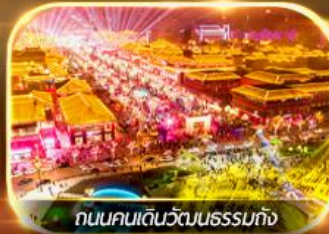
ถนนคนเดินวันนธรรมถิง