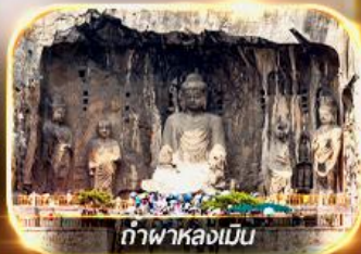
ถ้ำฟาหลงเหมิน