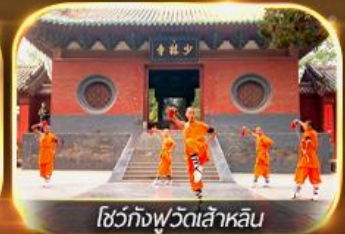
โชว์กั๋งฟู้วัดเส้าหลิน

เที่ยวนครซีอาน อุทยานสวรรค์หุ่นโกซ่าน ย้อนรอยอดีตกองทัพสุดยิ่งใหญ่