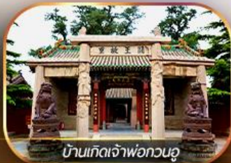
บ้านเกิดเจ้าฟกวงอู