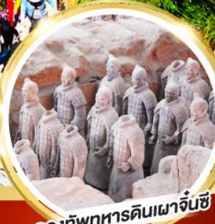
กองทัพทหารดินเผาจีนซี