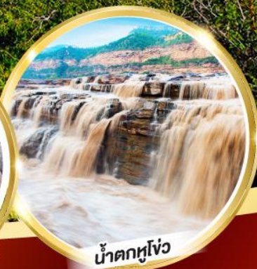
น้ำตกหูโจว