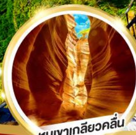
หุบเขาเกลียวคลื่น