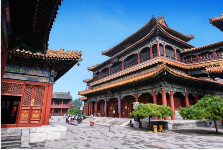
ศิลปวัฒนธรรมไว้อย่างลงตัว

เช้า 10 | รับประทานอาหารเช้า ณ ห้องอาหารของโรงแรม