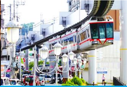
บึนรถไฟฟ้าแขวนรางเดี่ยว