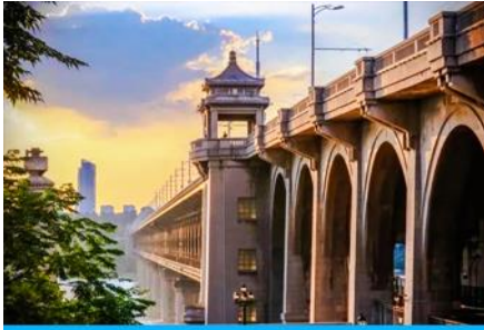
สะพานข้ามแม่น้ำหวู่อัน