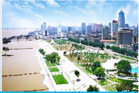
หาดฮั่นโข่วเจียงทาน