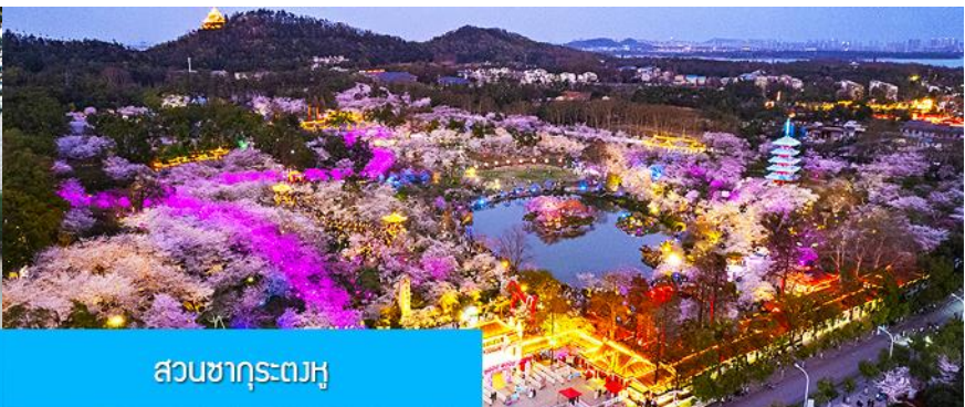
สวนซากุระตงหู