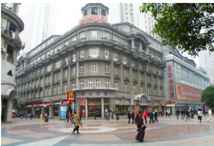
ถนนคนเดินเจียงฮั่นลู่