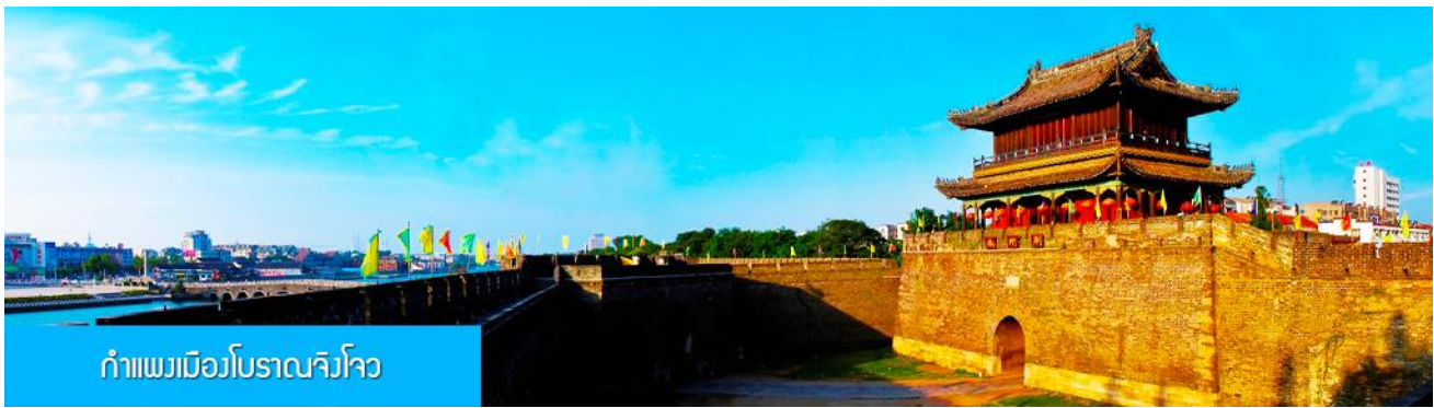
กำแพงเมืองโบราณจิงโจว