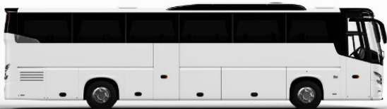
ตัวอย่างรูปภาพรถ 1 คัน

ค่าที่พักตามที่ระบุในรายการหรือเทียบเท่าระดับเดียวกัน (พักห้องละ 2 ท่าน) หากประเภทห้องที่ท่านริเคอสมาดูเพิ่มอีก เช่น ริเคอสห้องพักเป็น TWIN BED หรือ DOUBLE BED ทางบริษัทขอสงวนสิทธิ์ในการปรับประเภทห้องพัก เป็นตามที่โรงแรมมีอยู่ โดยไม่ต้องแจ้งให้ทราบล่วงหน้า