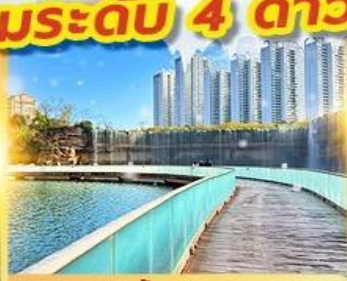
สวนน้ำตกคุณหมิง