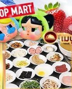
ขนมจีนข้ามสะพาน