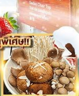
สุกี้เห็ด