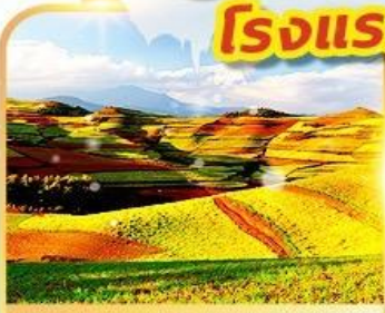
แผ่นดินสีแดงตองชวน