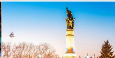
อนุสาวรีย์ฟิ่งหง