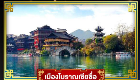
เมืองโบราณเซียงซือ