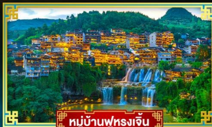
หมู่บ้านฟุหลงเจิ่น