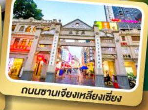
ถนนซานเจียงหลียงเซียง