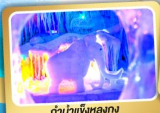
ตำนานเจิ้งหลงกง