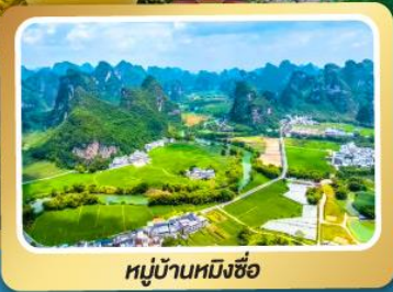
หมู่บ้านหมิงซือ