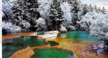
อุทยานหวงหลง