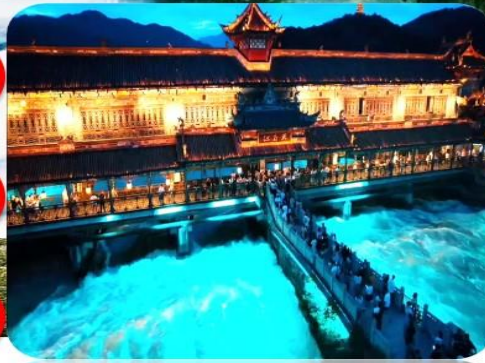
เมืองโบราณตูเจียงเยี่ยน