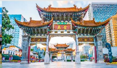
ประตูม้าทอง ไถ่หยก

*ทางบริษัทฯ ขอสงวนสิทธิ์ในการสลับโปรแกรมทัวร์ตามความเหมาะสมขึ้นอยู่กับสถานการณ์หน้างาน โดยคำนึงถึงผลประโยชน์ของลูกค้าเป็นสำคัญ