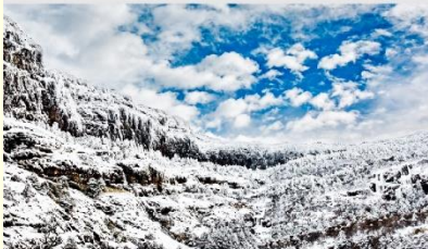
ภูเขาหิมะเจียวจื่อ