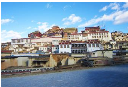
วัดลามะชวงจ้านหลิง

ที่ พัค YUE GUANG HOTEL ระดับ 4 ดาวท้องถิ่น หรือเทียบเท่าเมืองจงเตี้ยน หรือเซกกริลา