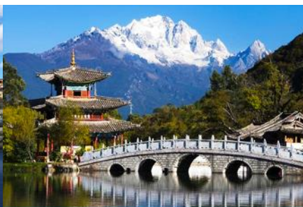
สะพานมังกรดำ