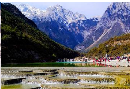
หุบเขาพระจันทร์สีน้ำเงิน "ป๋ายู่เหย่"