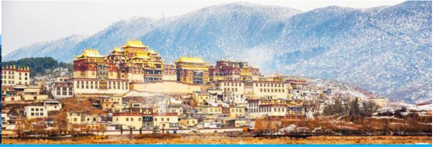
เมืองโบราณแซงกริล่า