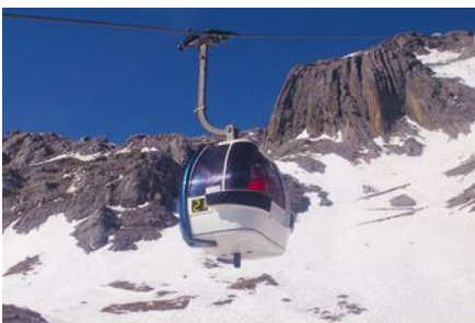
ภูเขาหิมะมังกรหยก (นั่งกระเช้าใหญ่)

ที่พัก FENG HUANG HOTEL ระดับ 4 ดาวท้องถิ่น หรือเทียบเท่าเมืองลี่เจียง