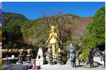
อุทยานน้ำหยก

วันที่สี่ ภูเขาหิมะมังกรหยก (รวมนั่งกระเช้าใหญ่ขึ้นลง)– หุบเขาพระจันทร์สีน้ำเงิน-น้ำตกป๋ายู่เหย่ ชมโชว์ IMPRESSION LIJIANG- อุทยานน้ำหยก -เมืองต้าหลี่