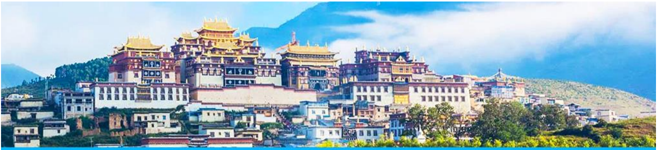
เมืองโบราณเซกกริลา

เมื่อเสร็จจากการเที่ยวชมช่องแคบเสือกกระโจน นำท่านเดินทางต่อสู่เมือง เซกกริลา ซึ่งอยู่ทางทิศตะวันออกเฉียงเหนือของมณฑลยูนนานซึ่งมีพรมแดนติดกับอาณาเขตนำซี ของเมืองลี่เจียง และอาณาจักรหยา ของเมืองหนิงหลง สถานที่แห่งนี้จึงได้ชื่อว่า ดินแดนแห่งความฝัน ที่ตั้งอยู่บนที่ราบสูงทางทิศตะวันตกเฉียงใต้ของจีน