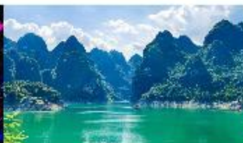
ทะเลสาบวานฟงหู