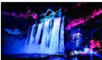
อุทยานน้ำตกหวงกั่วซู่