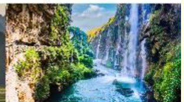
หุบเขาน้ำตกร้อยสายหม่าหลิงเหอ