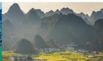
ป่าภูเขามื่นยอด