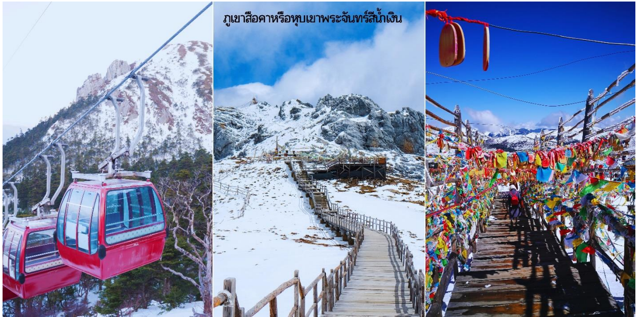
ภูเขาสีช่าหรือหุบเขาพระจันทร์สีน้ำเงิน

URGENT! เส้นทางนี้...เดินทางสู่พื้นที่สูงมากกว่า 2,500 เมตรจากระดับน้ำทะเล เนื่องจากมีความดันอากาศและออกซิเจนลดลง อาจเกิดการแพ้ที่ราบสูงได้ หากมีอาการรุนแรงรีบแจ้ง ไกด์หรือหัวหน้าทัวร์