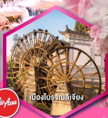
เมืองโบราณลีเจียง