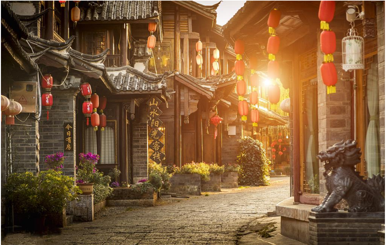
นำท่านชม เมืองโบราณลี่เจียง (Ancient Town of Lijiang) (ใช้เวลาเดินทางประมาณ 20 นาที)