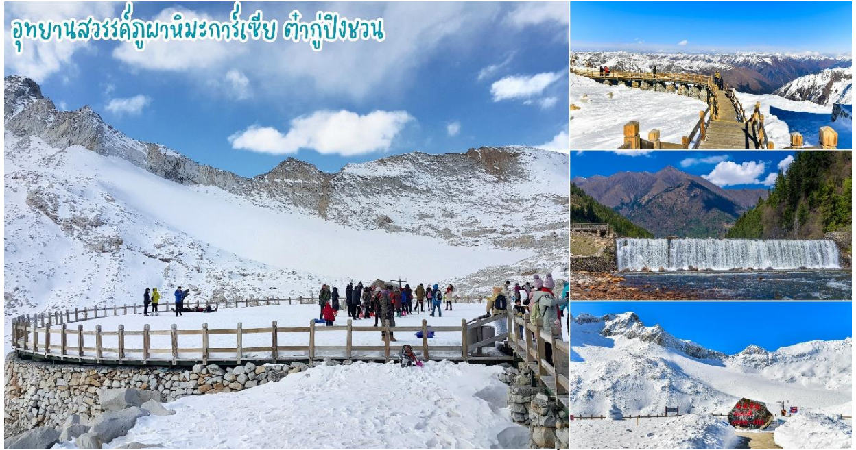
สะท้อนเข้าสู่ สายตาดังได้นั่งกระเช้าชมภูเขาสวรรค์ที่หาชมได้ยากยิ่งนัก จากนั้นเดินทางสู่เมืองเฉิงตู