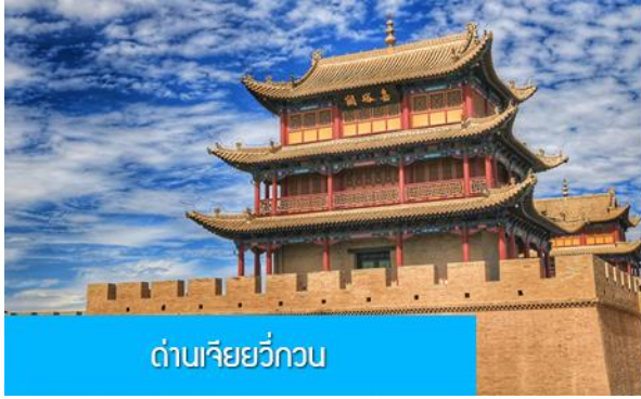
ด่านเจียยวี่กวน