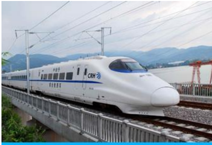
บั้งรถไฟความเร็วสูง

พักที่ HOLIDAY INN EXPRESS HOTEL โรงแรมระดับ 4 ดาวท้องถิ่น หรือเทียบเท่าใกล้สนามบินหลันโจว