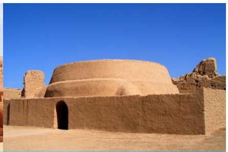
เมืองโบราณเกาซางถู่เจิง