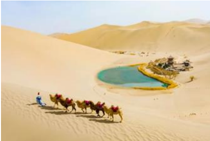
สระน้ำวงพระจันทร์