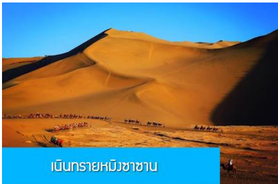
เนินทรายหมีงาซาซาน

พักที่ REZEN HOTEL ระดับ 4 ดาวท้องถิ่นหรือเทียบเท่าในเมือง เจียยวี่กวน