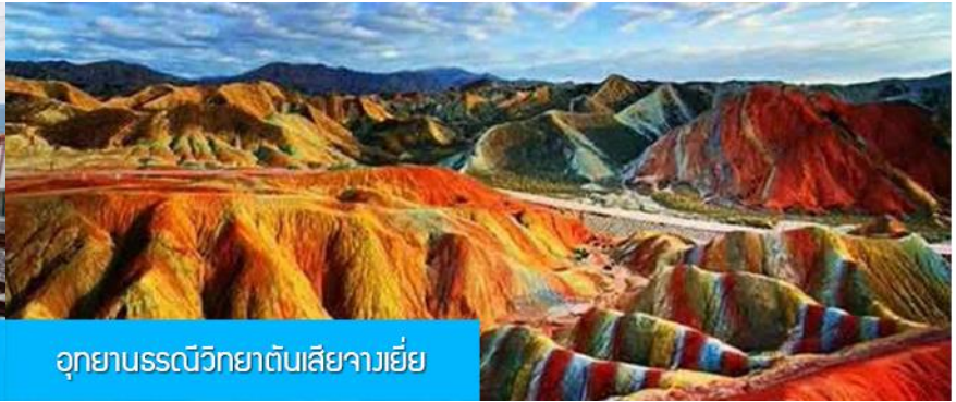
อุทยานธรณีวิทยาตันเสีจางเยี่ย