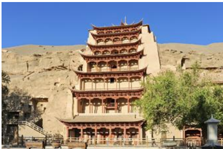
ถ้ำหินมั่วเกาฉู

พักที่ METRO PARK HOTEL โรงแรมระดับ 4 ดาวหรือเทียบเท่าในเมืองตุนหวง