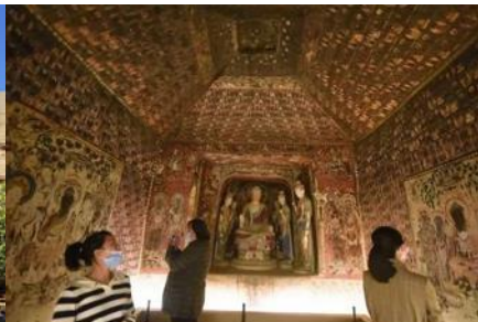
ชมภาพยนตร์ 3 มิติ