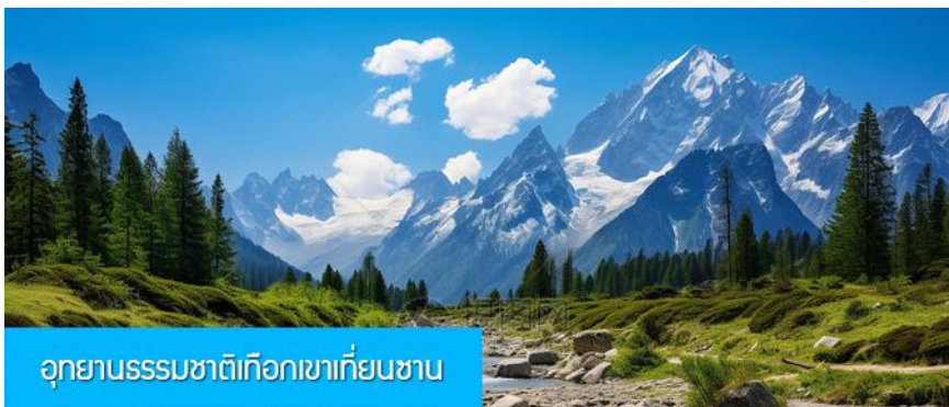
อุทยานธรรมชาติเทือกเขาเทียนชาน

พักที่ HAMPTON BY HILTON URUMQI HOTEL โรงแรมระดับ 4 ดาวหรือเทียบเท่าในเมืองอูรูมูฉี