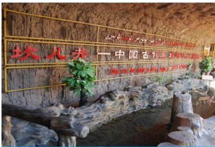
ระบบชลประทานถู่หลู่ฟาน

พักที่ HAMPTON BY HILTON HOTEL โรงแรมระดับ 4 ดาวหรือเทียบเท่าในเมืองถู่หลู่ฟาน