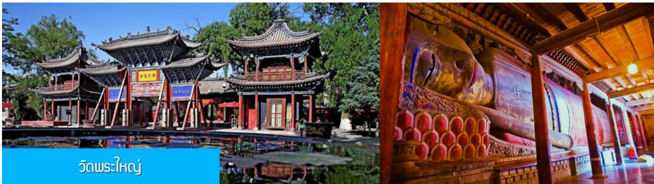
วัดพระใหญ่

พักที่ SI LU QIAN XI HOTEL โรงแรมระดับ 4 ดาวท้องถิ่น หรือเทียบเท่าในเมืองจางเจี้ยน