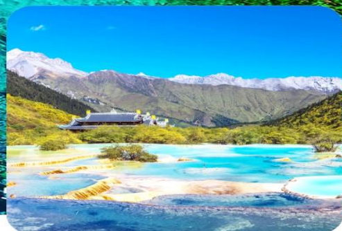
อุทยานหลวงหล่ง

เมนูพิเศษ สุกี้หม่าล่า บุฟเฟต์ ดันตำรับเสฉวน