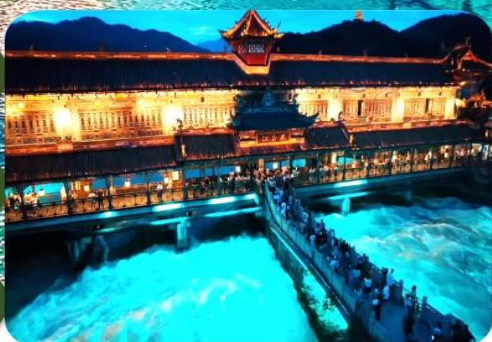
เมืองโบราณตูเจียงเยียน