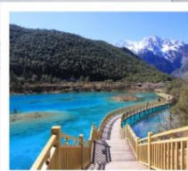
ไป๋สุ่ยเหอ

นั่งรถไฟความเร็วสูง จาก ลี่เจียง - คุณหมิง