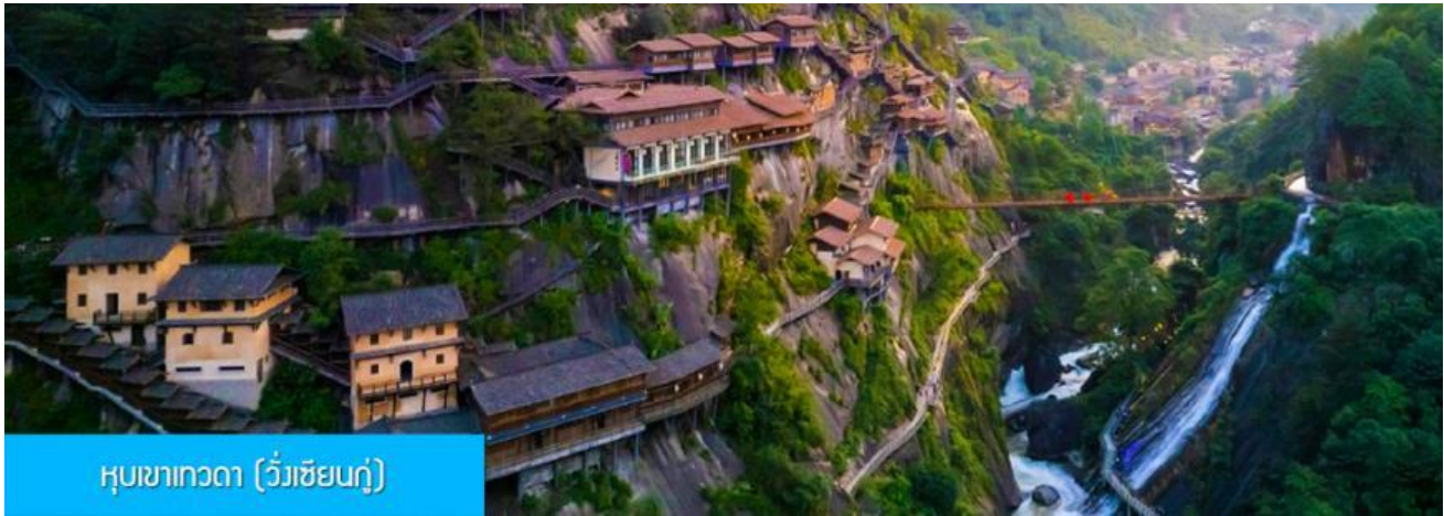
หุบเขาเทวดา (วังเซียนกู่)