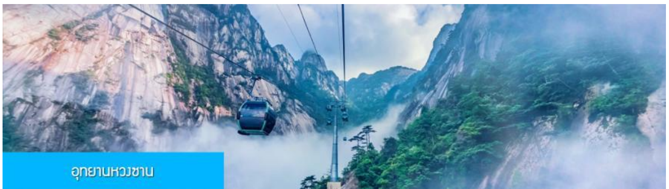
อุทยานหวงซาน

โรงแรมระดับ 4 ดาวท้องถิ่นหรือเทียบเท่าในเมืองหวงซาน