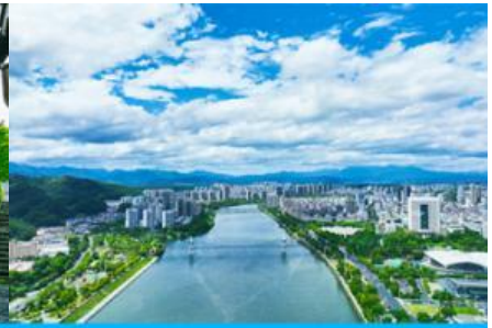
เมืองหวงซาน