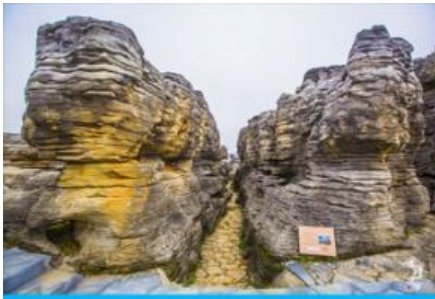
อุทยานป่าหินล้านปี