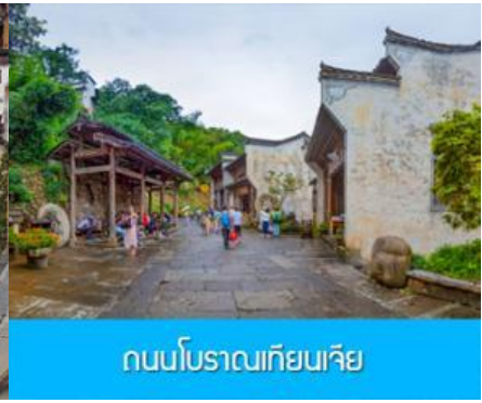
ถนนโบราณเทียนเจีย