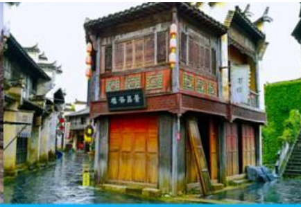
โรงถ่ายภาพยนตร์โชว์หลี่