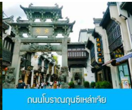
หมู่บ้านโบราณซีซีหนานซุน