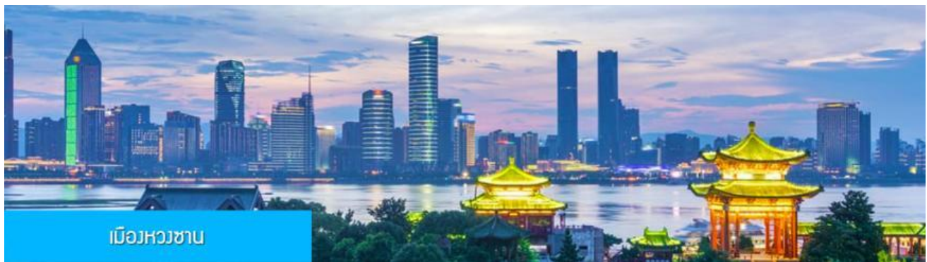
เมืองหวงซาง