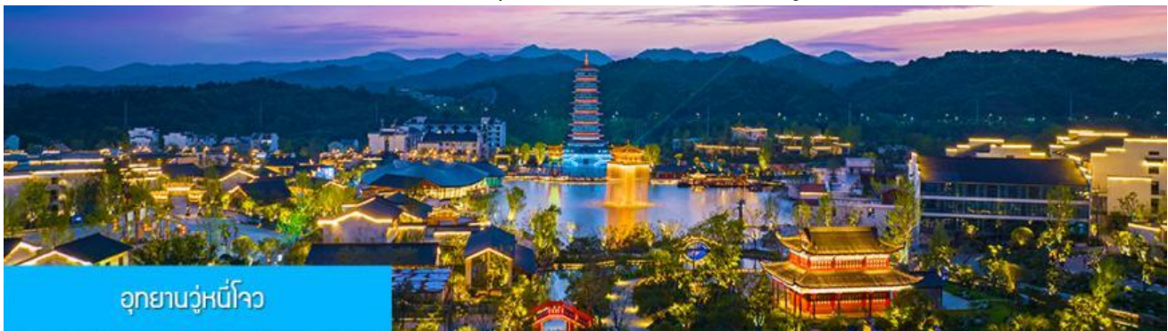
อุทยานวู่หนี่โจว