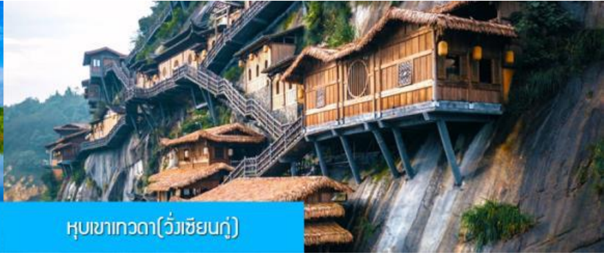
หุบเขาเทวดา(วังเซียนกู่)