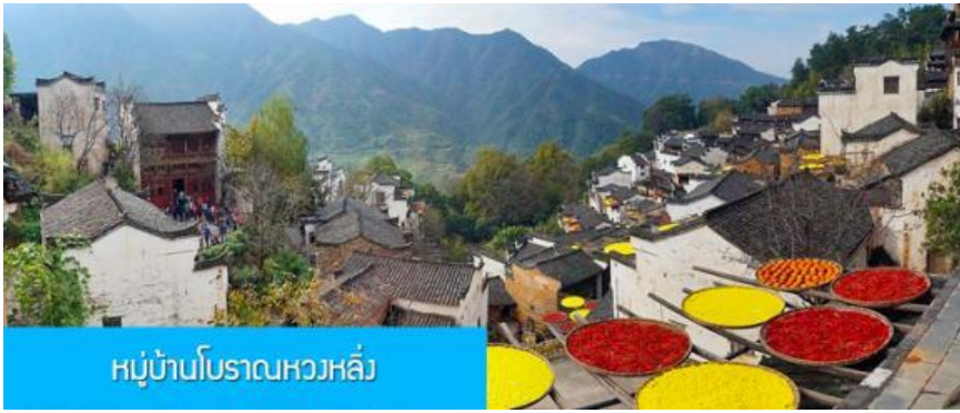
หมู่บ้านโบราณหวงหลิ่ง