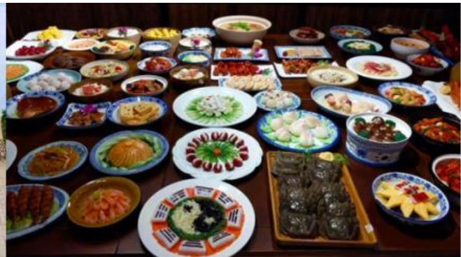
พิพิธภัณฑ์อาหารพื้นเมือง ฮุยโจว