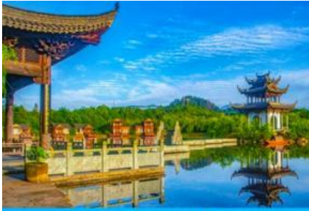
หมู่บ้านโบราณ สู้มั่วซิ่งเหอ