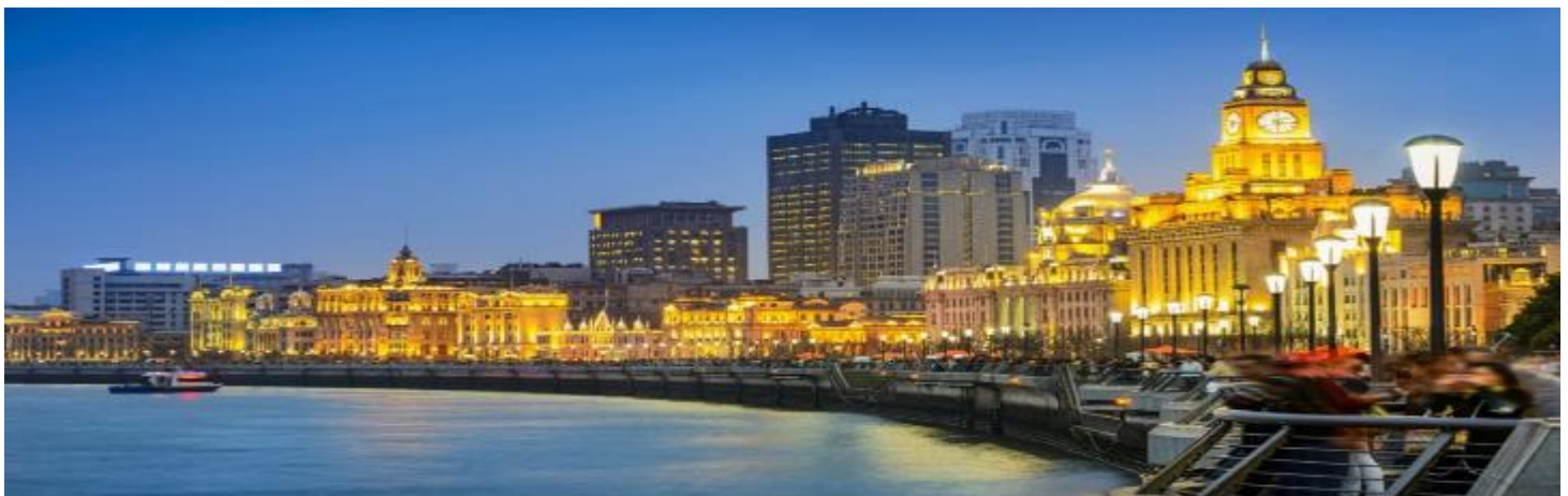
GO1PVG-CA005 ตะลอนเฉิงไฮ้ ปักกิ่ง 6วัน 4คืน (นั่งรถไฟความเร็วสูง) โดยสายการบิน Air China (CA)

07.00 น. เดินทางถึง ท่าอากาศยานนานาชาติเฉิงไฮ้ผู้ตงประเทศจีน เวลาท้องถิ่นเร็วกว่าประเทศไทย 1 ชั่วโมง (เพื่อความสะดวกในการนัดหมาย กรุณาปรับนาฬิกาของท่านเป็นเวลาท้องถิ่น) หลังจากท่านได้ผ่านพิธีการตรวจคนเข้าเมืองและศุลกากร