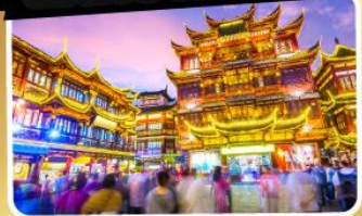
ตลาดร้อยปีเจิ้งหวงเมี่ยว