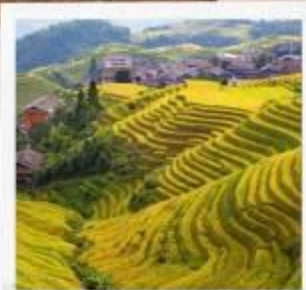
นาขั้นบันไดหลงจี้