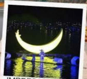
IMPRESSION LIU SANJIE