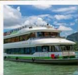
ล่องเรือแม่น้ำ หลี่เจียง