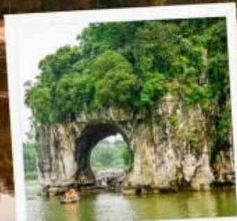
เขาวงกตช้าง