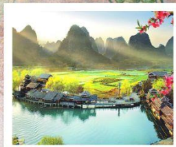
เมืองลิบไค