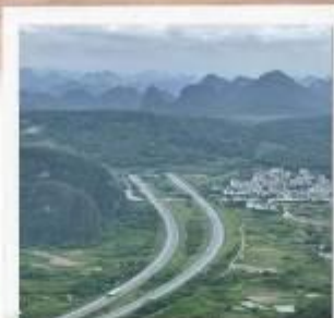
เขาหลุยี่