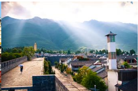
หมู่บ้านซีโจว(หมู่บ้านชาวป๋อ)