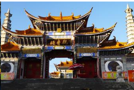
วัดเจ้าแม่กวบอิมเปลงกาย