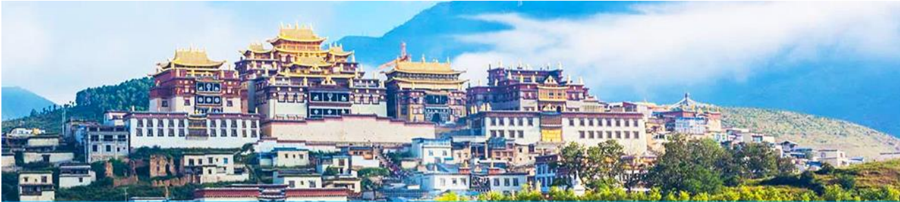
เมืองโบราณแซงกรี่ล่า

เที่ยง รับประทานอาหารกลางวัน ณ ภัตตาคาร จากนั้นนำท่านชม หมู่บ้านซีโจวหรือหมู่บ้านชาวไป่ ชนพื้นเมืองที่สำคัญของเมือง ชมการแสดงของชนชาติป๋ายพร้อมชิมชาสามแก้ว เพื่อรำลึกถึงวิถีชีวิตและการเกิดมาเป็นมนุษย์ของตนเอง ซึ่งถือเป็นเอกลักษณ์ของชนชาวไป่ ที่หาคุณ