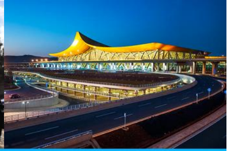
สนามบิณเมืองคุนหมิง

วันที่ทำ เมืองต้าหลี่-เมืองคุนหมิง-KUNMING WATERFALL PARK-ช้อปปิ้ง POP MART