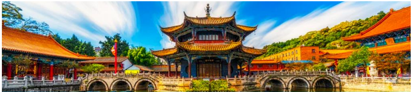
วัดหยวนกง

07.00 รับประทานอาหารเช้า ณ ห้องอาหารของโรงแรม รับประทานอาหารนำท่านเดินทางสู่เมืองคุนหมิงโดยรถบัสปรับอากาศ (ใช้เวลาเดินทางประมาณ 4 ชั่วโมง) เที่ยง เดินทางถึงเมืองคุนหมิง นำท่านรับประทานอาหารกลางวัน ณ ภัตตาคาร จากนั้นนำท่านเดินทางสู่ สวนน้ำตก “KUNMING WATERFALL PARK” สวนสาธารณะใจกลางเมืองคุนหมิงแห่งนี้ เปิดให้ใช้บริการเมื่อปีที่แล้ว ถือเป็นสถานที่ท่องเที่ยวแห่งใหม่และเป็นที่พักผ่อนหย่อนใจยอดนิยมของชาวเมืองคุนหมิงเลยทีเดียว Kunming Waterfall Park หรืออีกชื่อหนึ่งคือ Niulan River Waterfall Park เป็นสวนสาธารณะขนาดใหญ่ที่ใช้เวลาสร้างกว่า 3 ปีด้วยกัน ภายในประกอบไปด้วยน้ำตกและทะเลสาบอีก 2 แห่ง ที่สร้างขึ้นด้วยฝีมือมนุษย์ ไฮไลท์ของสวนอย่างน้ำตกใหญ่อีกชั้นนั้น กว้างกว่า 400 เมตรและมีความสูงถึง 12.5 เมตร ถือเป็นน้ำตกฝีมือมนุษย์ที่ยาวเป็นอันดับของเอเชียเลยทีเดียวได้ ค่ำ มอบเวลาให้ท่านอิสระช้อปปิ้ง ณ ร้าน POP MART รับประทานอาหารค่ำ ณ ภัตตาคาร พักที่ VIENNA HOTEL ระดับ 4 ดาว หรือเทียบเท่าในเมืองคุนหมิง