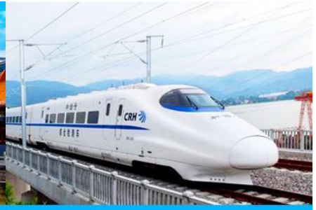
นั้รรถไฟความเร็วสูง