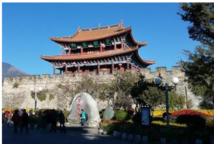
เมืองโบราณต้าลี่

18.26 น. เดินทางถึงเมืองต้าลี่ นำท่านสู่ภัตตาคารในเมืองต้าลี่ ค่ำ รับประทานอาหารค่ำ ณ ภัตตาคาร หลังอาหารนำท่านเข้าสู่ที่พัก พักที่ DALI ZHUANG HOTEL ระดับ 4 ดาวหรือเทียบเท่าในเมืองต้าลี่