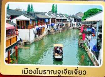
เมืองโบราณจู่เจียเจี้ยว