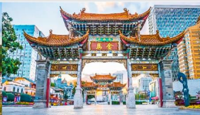
ประตูม้าทอง ไก่หยก